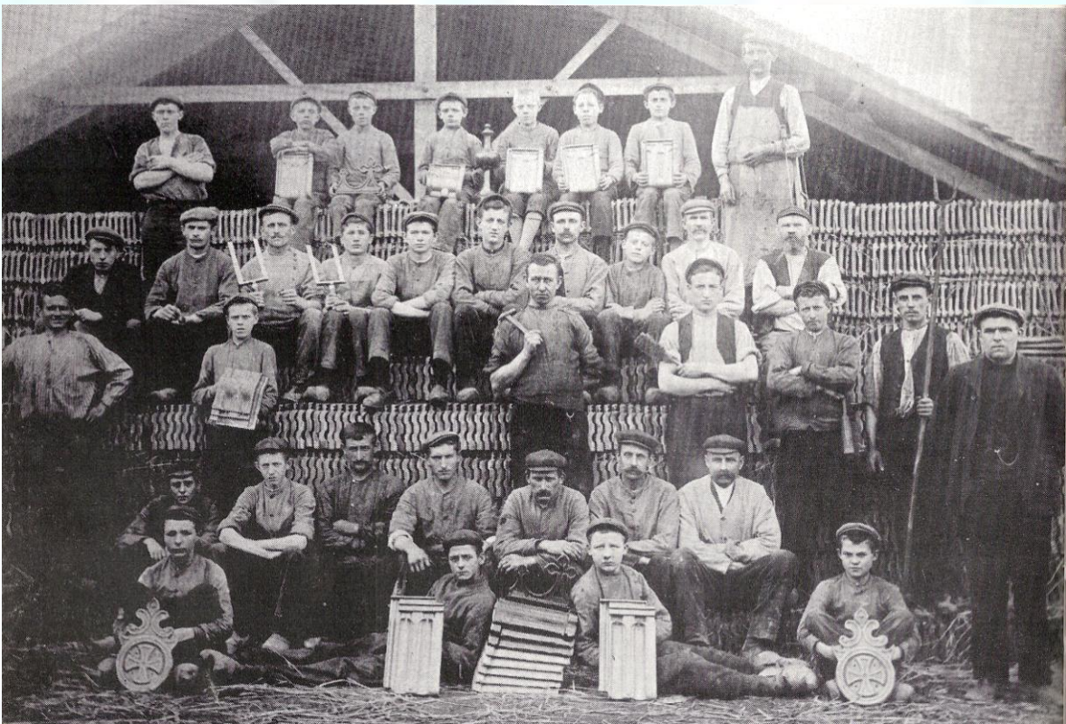
D e grofkeramische industrie verschaftte aan veel mensen werk. Hier het personeel van Kluytmans, Dobbelaere & Co te Swalmen